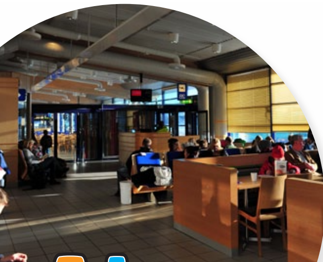
4. Informasjon fra Avinor om sikkerhet og rutiner som er viktige å huske på.