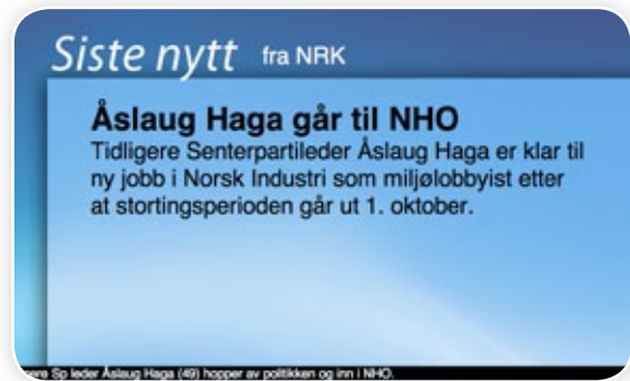
2. Nyhetsoppdateringer fra valgfri nyhetsleverandør vil vises med jevne mellomrom.