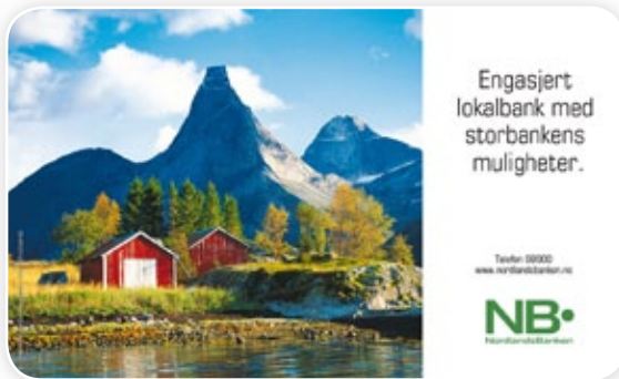
1. Eksempel på reklamespot

Dette vil samlet skape et nyansert og mer attraktivt budskap for de reisende.